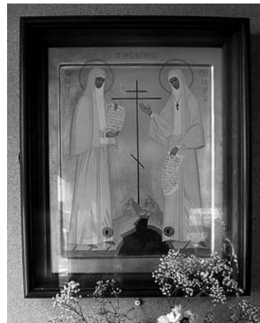
Икона Преподобномученицы Великой Княгини Елизаветы и инокини Варвары с частичками их мощей

ющих православие людей, нести им проповедь, приходиться к ним со Словом Христовым, а не с требованием, наглостью и ультиматумом. Ну а поддержка-то все-таки определённая есть. Вы же понимаете: если бы власть не захотела, то не было бы у нас земли и этого пока только временного храма. Но благодаря доброй воле властей мы построили временный храм, и я расцениваю это как серьёзный положительный импульс в наших взаимоотношениях. Как пожелание мы бы очень хотели, чтобы власть имущие помогли бы нам найти инвесторов и спонсоров, то есть попечителей. Ведь если они постараются, то многое удастся сделать в отношении строительства постоянного действующего храма. Хотелось бы, чтобы мы не были поставлены на одну доску с прочими застройщиками, чтобы строгие требования к наличию и готовности всех документов на строительство были бы заменены, скажем, чуть более мягкими требованиями, так как нам очень непросто вписаться в жесткие рамки современных строительных реалий.