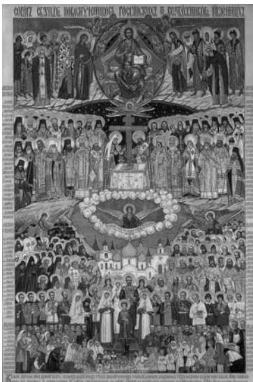
Икона Святых Новомучеников и исповедников Российских

обманщиками, врагами народа. Россия не сможет идти вперед, если она не освободится, наконец, от лжи, накопившейся за предыдущее столетие. Не пора ли перестать уделять вождям недавнего прошлого несоразмерно много внимания, продолжая, так или иначе, создавать им культ, мистифицируя их заурядные персоны, возвеличивая их ничтожество и ограниченность. Господь ныне открывает нам имена и лики тех, кто оставался в многолетнем забвении, униженных и оклеветанных, претерпевших до конца, но не отказавшихся от креста Христова, лучших людей России, составляющих её немеркнущую славу и достояние.