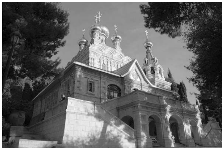
Храм Святой Марии Магdalены

гания и уже горящего огня. Кувуклия заранее опечатывается каждым членом комиссии, и печати всенародно вскрываются