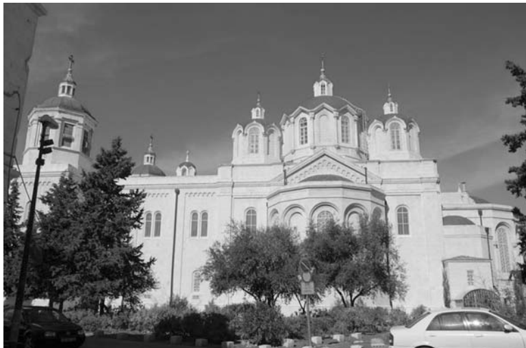
Троицкий собор на территории Русской духовной миссии