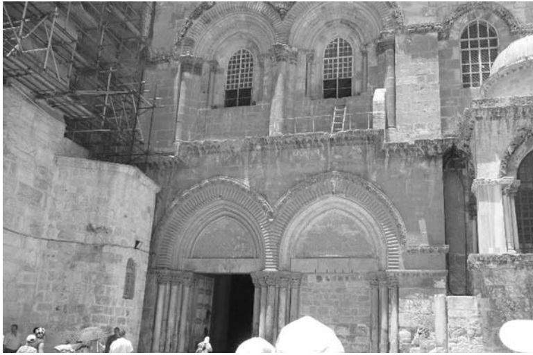
У входа в храм Гроба Господня в Иерусалиме в Великую субботу