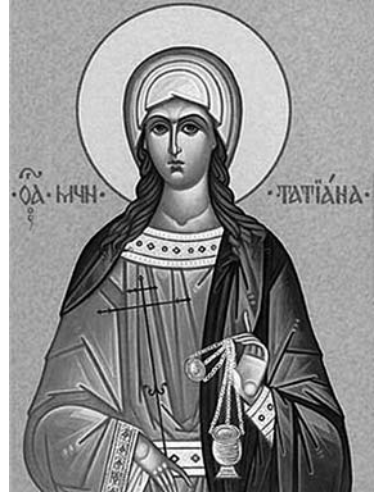
Святая мученица диакониса Татиана Римская

смертью до последнего будет следовать Христу. Побиваемый камнями архидиакон Стефан до последнего вздоха молился и умер с молитвой об убийцах на устах: "Господи! не вмени им греха сего" (Деян 7:60).