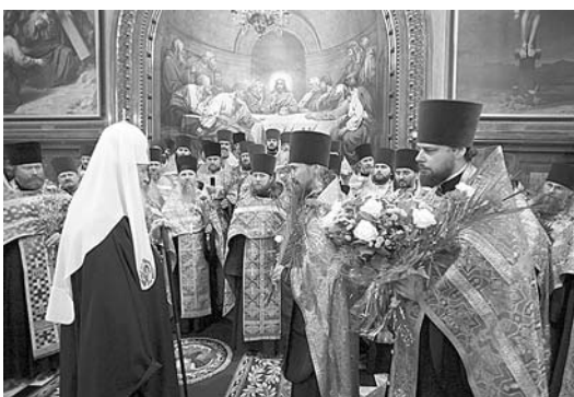
Святейший Патриарх Кирилл с награжденными