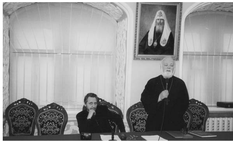
На съезде преподавателей церковного пения духовных училищ. Троице-Сергиева Лавра, 2004 г.

— После 1988 года всё цивилизованное человечество отметило 1000-летие Крещения Руси. Но помимо духовной исторической ценности, эта дата приобрела огромное значение для церковной музыки. Потому что в отличие, скажем, от иконописи и церковной архитектуры именно церковная музыка была под строжайшим запретом в Советском Союзе. Её нельзя было ни изучать, ни исполнять. Она практически пребывала под спудом. А в год 1000-летия Крещения Руси с этой сферы фактически сняли запрет. Стали выдавать ноты из спецхранов, появились книги, пошло постепенное увлечение студентов этой музыкальной тематикой, особенно в 90-е годы, стали писать диссертации. В странах СНГ уже около 60 кандидатов и докторов наук работают по этому направлению. А когда открылись духовные училища, семинарии, появилась востребованность в нотах, стали в большом количестве издаваться ноты, компакт-диски. Словом, возник огромный интерес к этой сфере. Надо сказать, что на периферии он до сих пор не иссякает, и там концерты церковной музыки, которые проводятся крайне редко, привносятся к экзотике. Одновременно с этим и Европа открыла для себя это музыкальное направление. И наряду с этим часть музыкантов, хоровиков, регентов стала проявлять интерес к знаменному распеву и вводить его в богослужебную практику. Мы помним, что когда стали от-