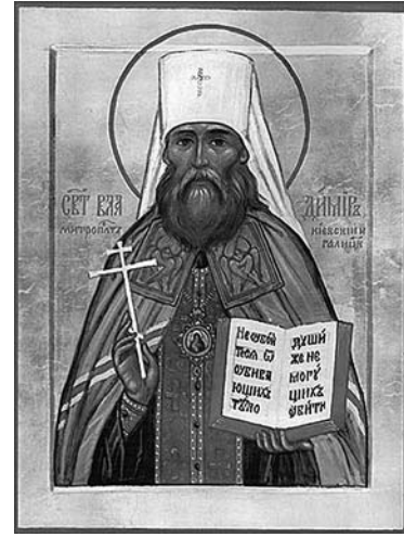
Митрополит Киевский Владимир (Богоявленский)

Святой преподобный Серафим Саровский. Преподобного Серафима, встречавшего каждого приходящего к нему словами: "Радость моя", однажды жестоко избили и искалечили разбойники, из-за чего он остаток жизни ходил согбенным. Но когда этих лихих людей отыскали, святой Серафим простил их и просил не наказывать.