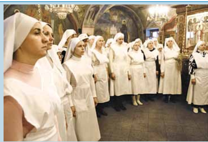
На молебне по случаю завершения обучения сестер милосердия в Сестричестве в честь святого великомученика и целителя Пантелеимона при храме Живоначальной Троицы в Хорошеве.

Сестры Сестричества в честь святого великомученика и целителя Пантелеимона.