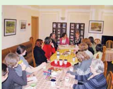
Родительский клуб «Берега»