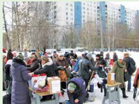
Приходская ярмарка вещей

ются люди, которые могут в порядке своей очереди (примерно 1 раз в месяц) подготовить чаепитие (расставить столы, заварить чай, разложить сладости), а также убрать все оборудование после его проведения.