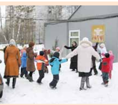
Детская воскресная школа