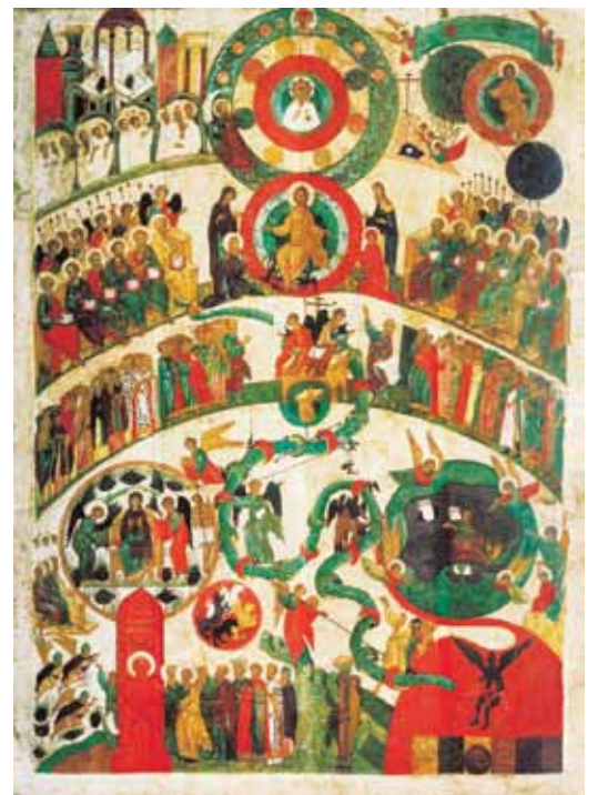
Страшный Суд. Середина 15 века, Новгород.

стит нам пролить кровь за Него, то тогда Он даст и силы понести это, «и волос с головы не спадет нашей» без воли Его (Лк.21:18). Мы видим это на примере наших дорогих новомучеников. Нужно ежесекундно прилепляться ко Христу, быть с Ним, любить Его, несмотря на все наши немощи, слабости и малодушие. Важнее помнить о личном «конце света», который может наступить для каждого из нас в любую минуту.