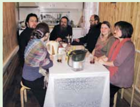
Приходской клуб для будущих мам

и либо направляет человека в соответствующее профильное учреждение, либо оказывает посильную помощь на приходе: предоставляет пищу, одежду, работу, материальные средства на билет или проживание.