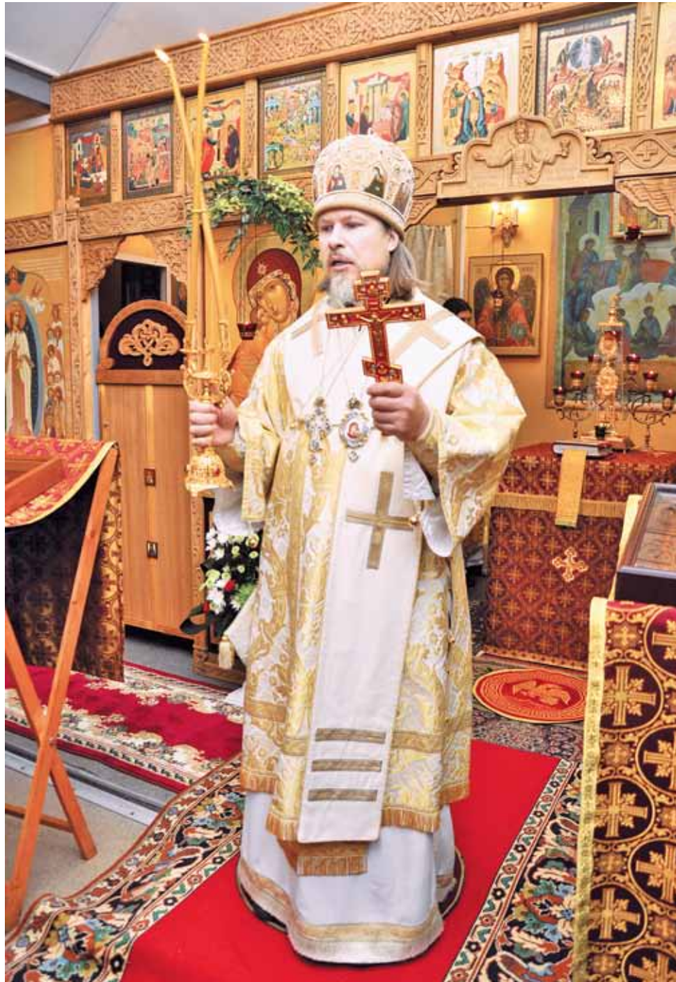
Архиепископ Егорьевский Марк совершает Божественную литургию в Храме Новомучеников в Строгино 13 февраля 2011 года

Интервью с иереем Игорем Константиновым: «Очевидно, что многие церковные постановления этого периода несут на себе след государственного вмешательства в жизнь Церкви...» стр. 7