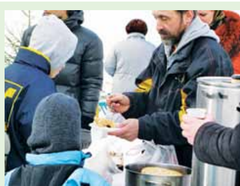
Воскресное чаепитие для прихожан (Масленица)

Описание: Приходская служба работы со случаем предоставляет разовую помощь людям, которые обращаются в храм со своей бедой: бездомным, голодным, больным, алкоголикам. При поступлении обращения работник службы работы со случаем рассматривает все обстоятельства, заполняет анкету