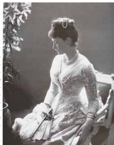
Великая княгиня Елизавета Феодоровна Романова

К 1917 году в России существовало около 115 общин сестёр ми-