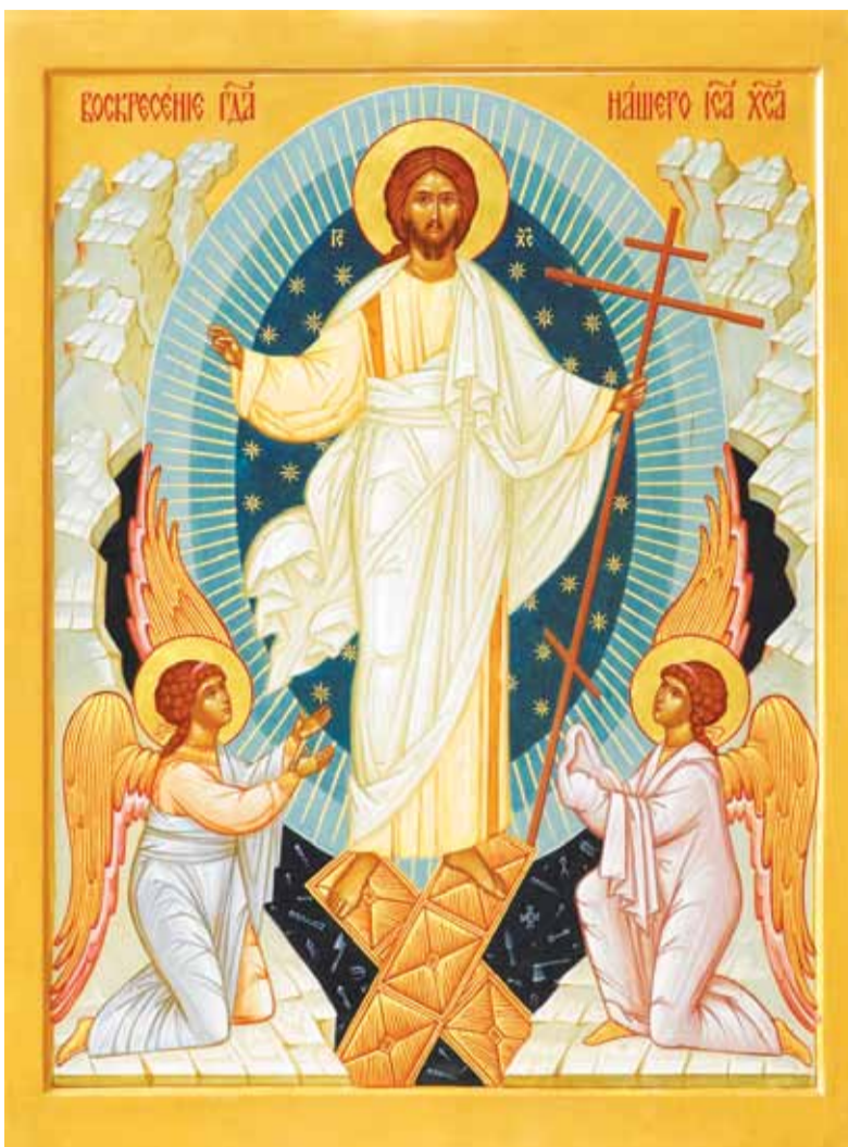
Икона Воскресения Христова. Храм Новомучеников в Строгино

Через Воскресение Христово верующий человек обретает возможность приобщиться к ниспо-