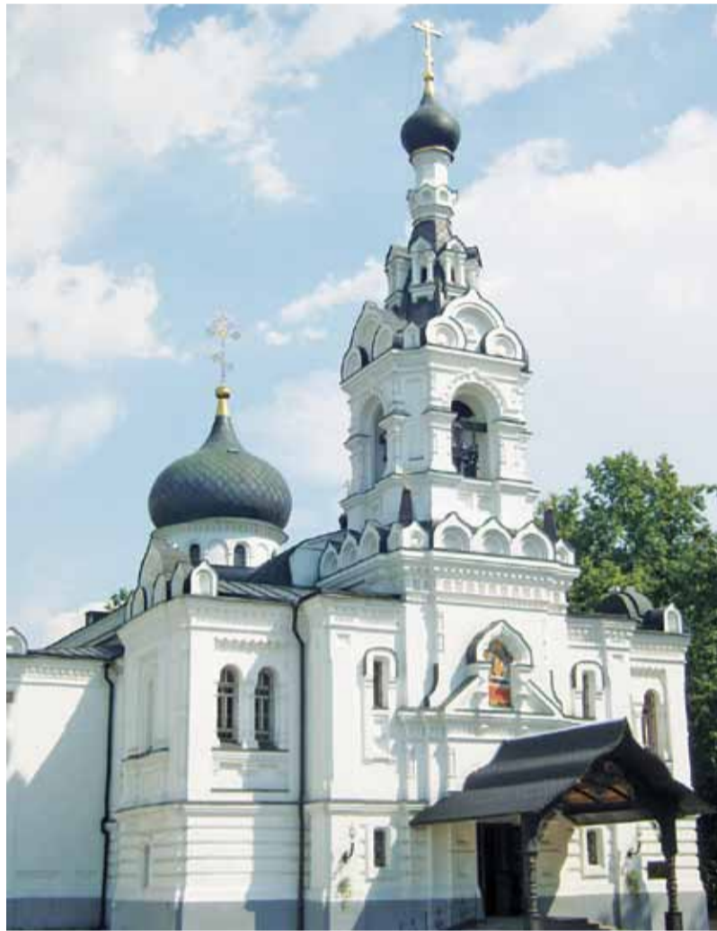
Храм Успения Божией Матери в Троице-Лыково