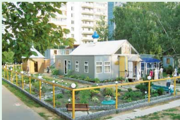
Временный храм Новомучеников и Исповедников Российских в Строгино

Каждый может прийти, посидеть на тихой уютной скамеечке, поразмышлять о чем-то своем. И мы надеемся, что и неверующий человек, будучи тронут этим внешним благолепием, постепенно придет к Богу. В скором будущем сад, который уже есть, будет организован как мини-ботанический: растения будут снабжены указателями с названиями и их особенностями.