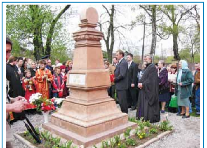
Памятник жителям Троице-Лыково, погибшим в Великую Отечественную войну. Установлен общиной храма Успения Пресвятой Богородицы. Ухаживают за ним юные прихожане – учащиеся православной гимназии