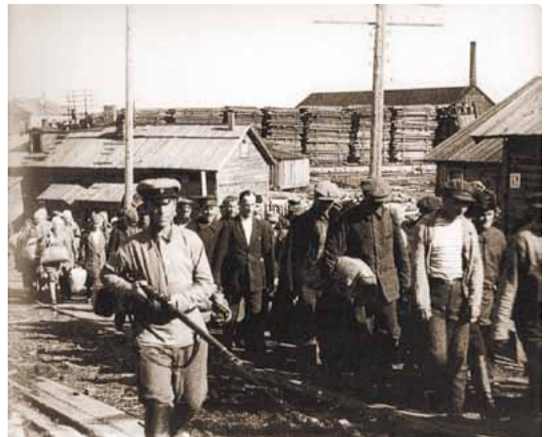
Прибытие новой партии заключенных в СЛООН

В кратчайшие сроки в стране была создана полноценная