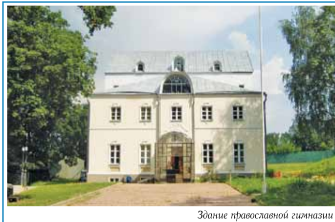
Здание православной гимназии

– Я ни у кого денег не просил, – вспоминает батюшка. – Говорил: надо помочь, хочешь-не хочешь, а десятую часть должен Церкви. Видишь, у меня храм какой, людям нужно молиться, не в сарае же им молиться! Просил не денег – металл, стройматериалы. Деньги дадут – хорошо, но не мне – на счет храма. И люди перечисляли, и приходили, и приносили. Кирпич принесут – спасибо,