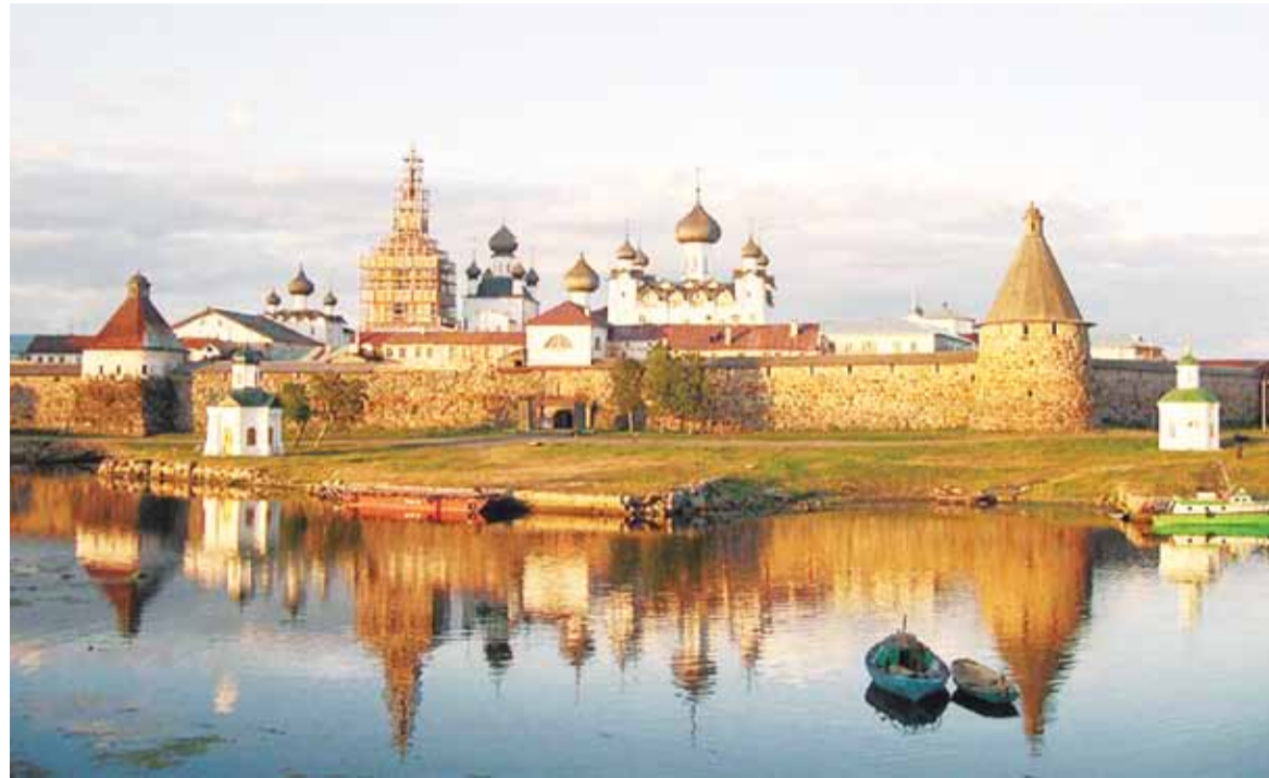
Спасо-Преображенский Соловецкий мужской монастырь

В истории Соловков уже был трагический период, когда братию Соловецкого монастыря подвергали избиению и физическому уничтожению. Он был связан с Соловецким восстанием («Соловецким сидением») 1667–1676 гг. Участники его — монахи, не принявшие церков-