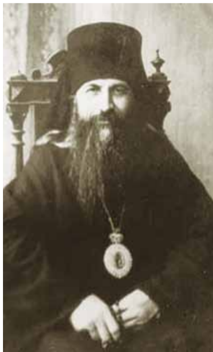
Священномученик Василий, епископ Прилуцкий

Декларация Митрополита Сергия 1927 года «Об отношении Православной Российской Церкви к существующей гражданской власти» представляла собой послание правительству, где, прежде всего, отмечался факт ожесточенной вредительской и диверсионной деятельности «наших зарубежных врагов», в связи с чем особо важно «теперь показать, что мы, церковные деятели, не с врагами нашего Советского государства и не с безумными орудиями их интриг, а с нашим народом и Правительством». Таким образом, Митрополит Сергий проводил политику безусловного потворства коммунистическому режиму. Послание вызвало бурную реакцию в церковной среде. Значительная часть духовенства и мирян в России не приняла Декларацию. Все священнослужители, несогласные с позицией Митрополита Сергия, объявлялись контрреволюционерами, многие из них впоследствии попали на Соловки.