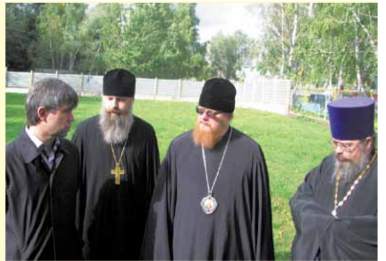
Епископ Подольский Тихон проводит выездное совещание на будущей строительной площадке

От Патриархии выполнение программы строительства курирует епископ Подольский Тихон, председатель Финансово-хозяйственного управления. В субботу, 24 сентября, когда владыка Тихон был в нашем храме, он сказал, что сотрудничество между Русской Православной Церковью и Российским государством перешло в качественно новую фазу. Как наша Церковь, так и наше государство осознают, что те общие задачи, которые стоят перед ними, они смогут решить только совместными координа-