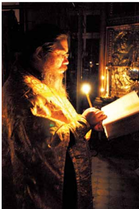
Протоиерей Георгий Крылов