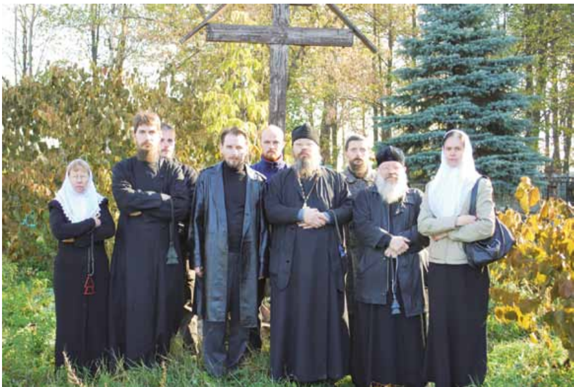
Знаменный хор храма Новомучеников и Исповедников Российских в Строгино

— Единоверцы — это те, кто после литургической реформы XVII века про-