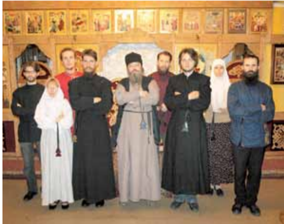
Знаменный хор храма Новомучеников и Исповедников Российских в Строгино

– Введение этих служб связано с наличием на приходе группы интеллигенции, интере-